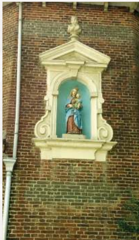
Afbeelding 7: oost- en westgevel naast elkaar