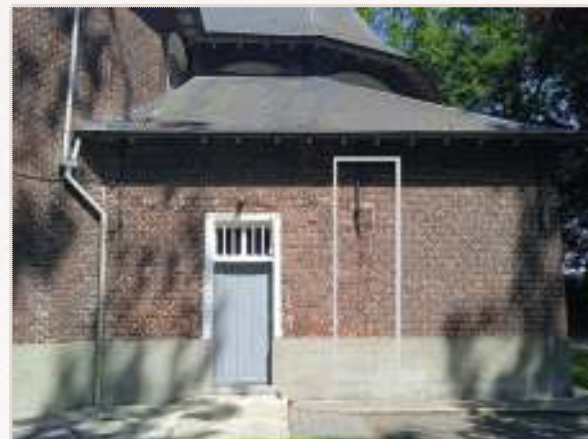
Afbeelding 13: de uitbreiding van de sacristie is ook duidelijk te zien in de muur aan de kant van de buitendeur van de zuidsacristie. Aan de bovenzijde zijn tevens de restanten te zien van de dichtgemetselde ramen.

De kapel is een typisch voorbeeld van een voor 1450 bestaande bedevaartskapel die werd wederopgebouwd en vergroot in het begin van de 17de eeuw, verwoest in 1644, gerestaureerd in 1649, vergroot in 1677, uitgebreid in 1774 met een nieuw koor en twee zijkoren en eind van de 19de eeuw werd gerestaureerd en uitgebreid met een noordelijke sacristie