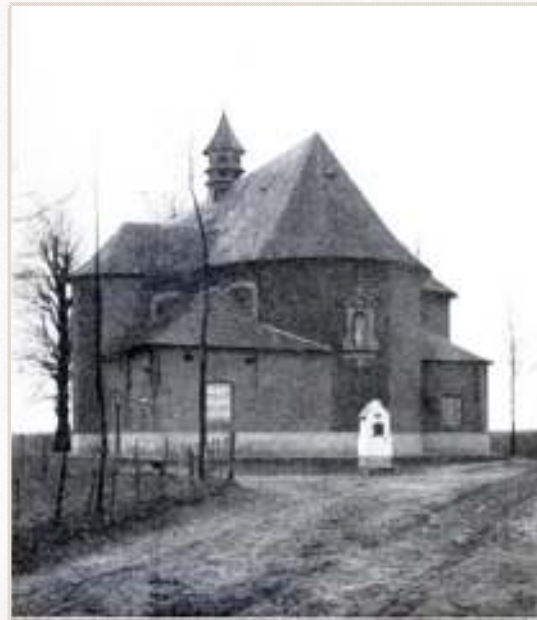
Ertvelde. — N.D. de Stoep.

Na de indrukwekkende uitbreiding van 1774, duurt het nog een halve eeuw eer men aanvang neemt met de bouw van zuid- en noordsacristie. Het is echter onwaarschijnlijk dat in de tussenperiode er geen sacristie was. Mogelijk stond op de plaats van de zuidelijke sacristie een voorlopig houten gebouwtje.