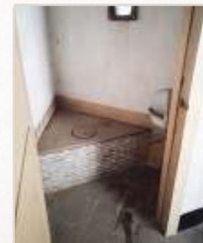
Afbeelding 14: het toilet in de noordelijke sacristie

Fijn detail: de noordelijke sacristie werd voorzien van een toilet voor de geestelijken. ■