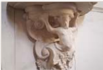
Afbeelding 8: houtsnijwerk als deel van de lambriering in de linkerbeuk

Een eeuw lang bleef het kapelgebouw onveranderd tot in het laatste kwart van de 18 e eeuw pastoor Jean Baptist De Smet (1773 – 1802), kort voor de Franse Revolutie en helemaal aan het begin van zijn pastoraat, het heft in handen neemt en voor een indrukwekkende uitbreiding van de kapel zorgde.