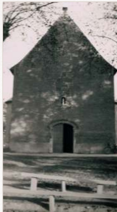
Afbeelding 18: de houten poort die in 1965 werd vervangen