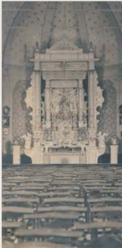
Afbeelding 4: zicht op het altaar, tabernakel en sterrenhemel aan plafond

In 1663 kwamen er een nieuwe preek- en biechtstoel.