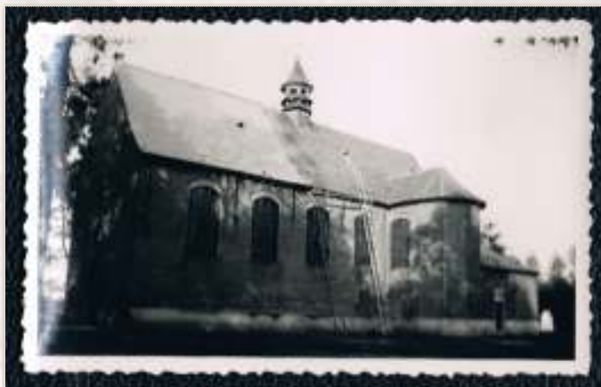
Afbeelding 15: dakwerken eerste helft 20e eeuw

Na de voltooiing van de sacristieën kennen we het kapelgebouw zoals het er vandaag de dag uitziet. In de loop van de 20 e eeuw waren er wel belangrijke onderhouds- en aanpassingswerken.