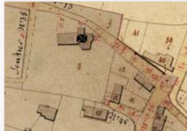
Afbeelding 11: kaart uit de "Atlas der Buurtwegen" 1841

uit 1873 op de volgende pagina). Wellicht betekent dit dan dat er nog een eerdere versie bestond van de sacristie in hout(?) opgetrokken, zoals dit ook het geval was in 1641?