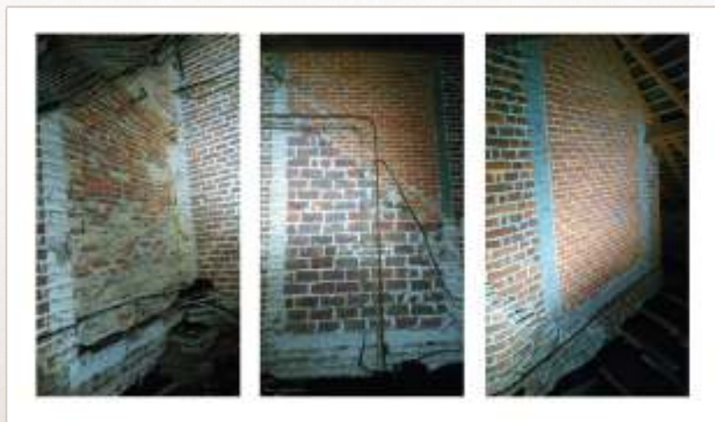
Afbeelding 12: zicht onder het dak van de zuidsacristie

Wat opvalt, zijn de totaal verschillende manieren waarop de raamopeningen zijn dichtgemetseld. Is hier toch sprake van twee verschillende fasen?