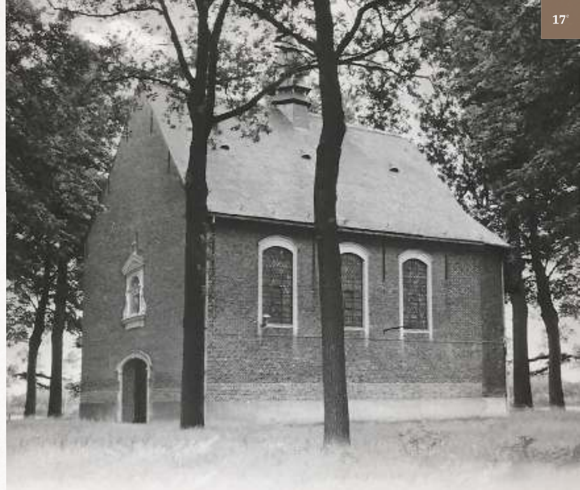
Afbeelding 6: reconstructie van de kapel zoals ze er tussen 1677 en 1774 zou uitgezien hebben