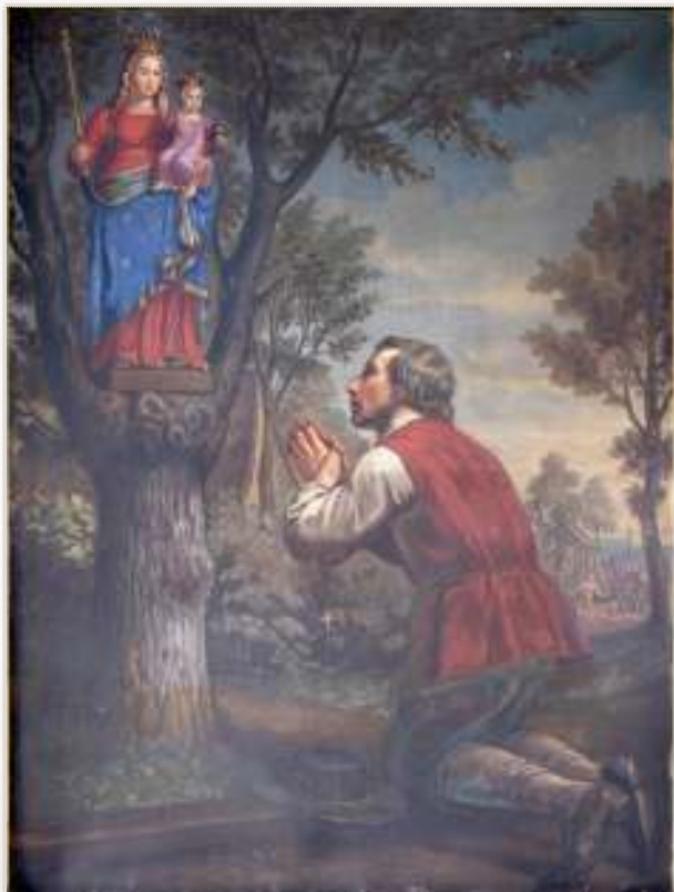
Afbeelding 1: schilderij uit 1860 dat het eerste mirakel van Stoepe verbeeldt. De volkstoeloop die hierop volgde, gaf het startsein voor de bouw van de kapel.