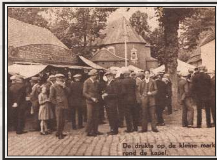
Afbeelding 16: de Stoepedagen 1937

In het midden van de jaren '30 is er elektriciteit aangelegd in de kapel. Op afbeelding 10 is te zien dat er toen nog geen elektriciteitspaal stond op de hoek van het Kapelhof. Op de sfeervolle foto van de Stoepedagen van 1937 uit de krant Zondagsvriend, is in het midden achteraan ondertussen een elektriciteitspaal te zien.