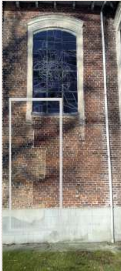
Afbeelding 5: op deze foto is duidelijk te zien tot waar het schip van de kapel kwam. Had deze eerdere fase van de kapel dus maar 3 ramen in het schip i.p.v. 4 tegenwoordig?

Het schip van de huidige kapel dateert dus van 1677! ■