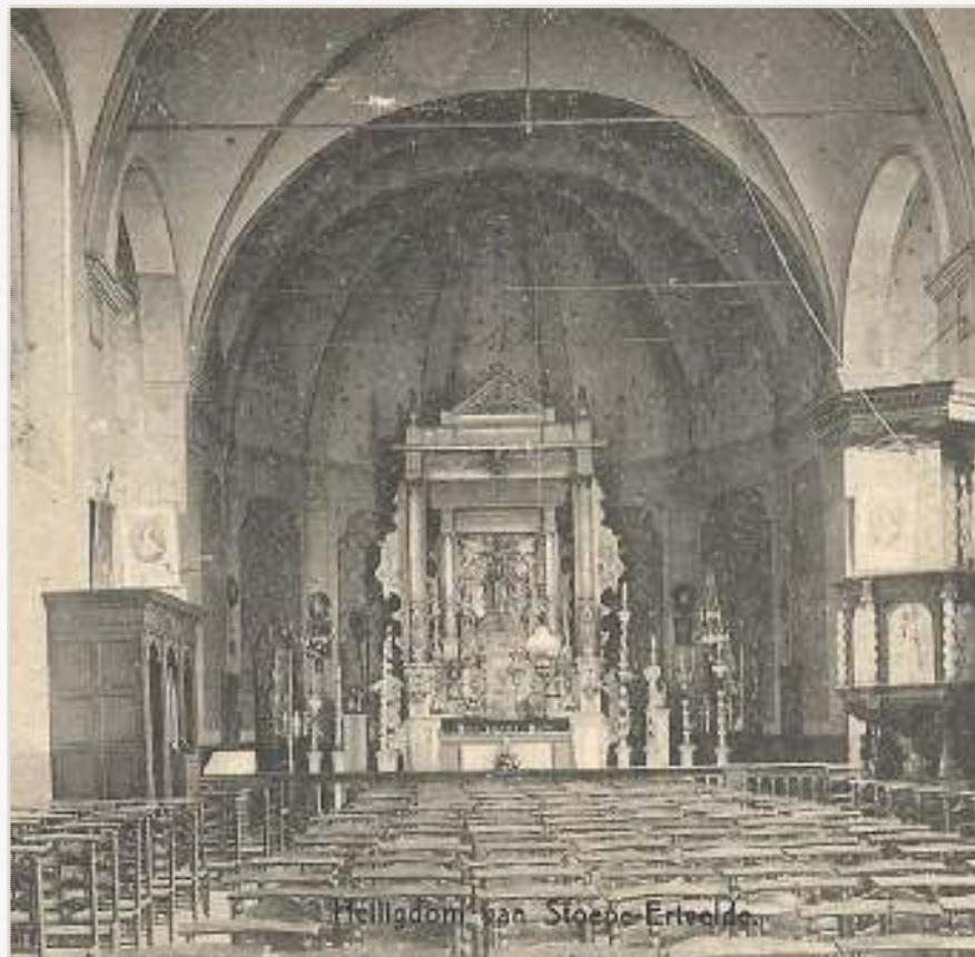
Afbeelding 9: in de 18e eeuw waren er drie biechtstoelen

Er is een verhaal dat vertelt dat, toen onder het bewind van Napoleon belasting werd geheven op basis van het gebruik van dure materialen in of aan een gebouw, de biechtstoelen werden geschilderd om het massieve hout te verbergen.